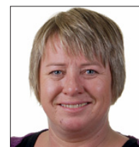
Eirin Sund Arbeiderpartiet Stortingsrepresentant