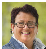
Olaug Vervik Bollestad Kristelig Folkeparti Ordfører i Gjesdal og Stortingskandidat.