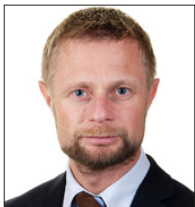
Bent Høie Høyre Leder av Stortingets helse- og omsorgskomite